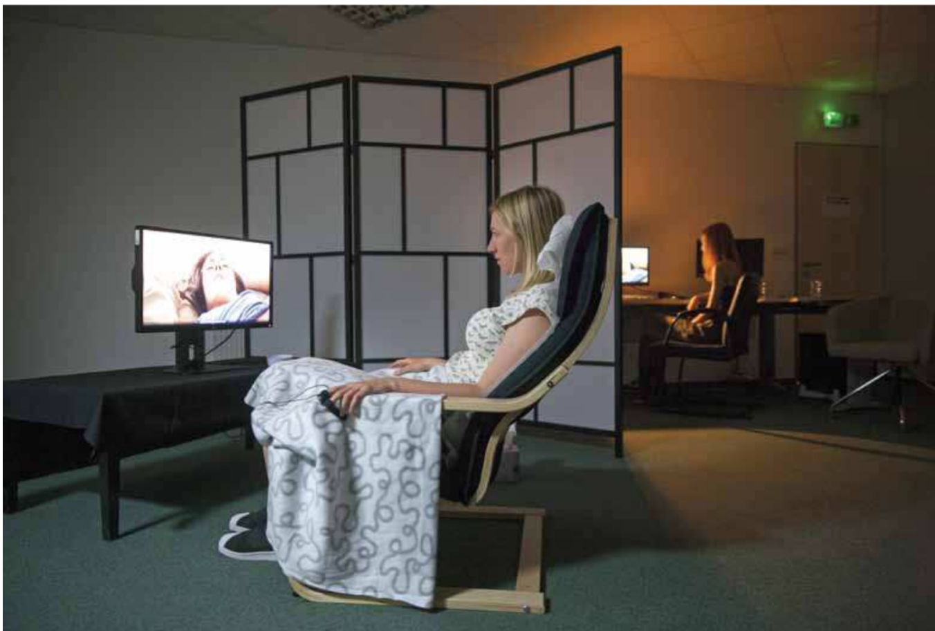
A za chvíli počítat králíky. (Výzkum vzrušivosti v Národním ústavu duševního zdraví)

stavovala různé erotické situace, třeba že ji po těle hladí muž, který ji přitahuje.